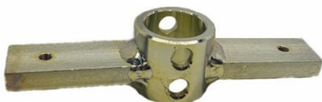
Фото Коромысло регулировки положения стрелы G4040Z, G4040IZ CAME 119RIG336

Тел: +7 499 681-75-28 | Email: sale@came-russia.ru | https://came-russia.ru