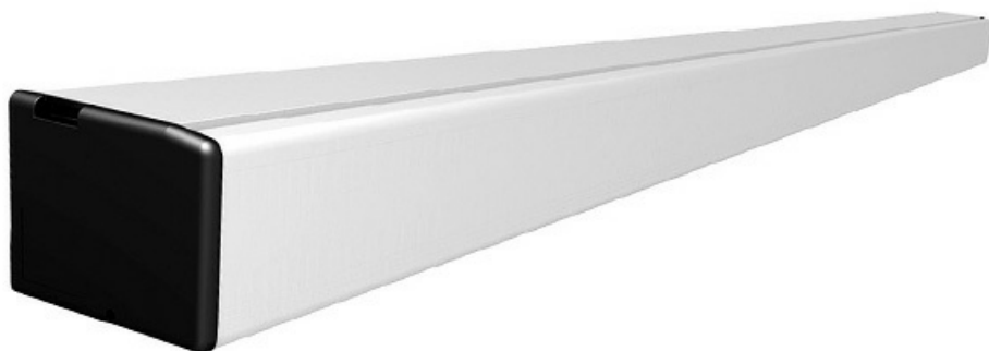
Фото Автоматика для двустворчатой раздвижной двери, FLUO-SLS STANDARD, короб 2000 мм CAME 818SL-0040

Отправьте запрос на коммерческое предложение и получите индивидуальные цены и сроки поставки