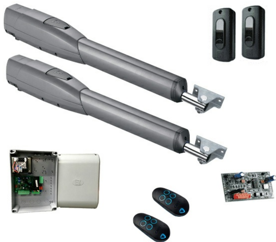
Фото Комплект ATS30AGM автоматики для двухстворчатых распашных ворот CAME 8K01MP-038

Отправьте запрос на коммерческое предложение и получите индивидуальные цены и сроки поставки