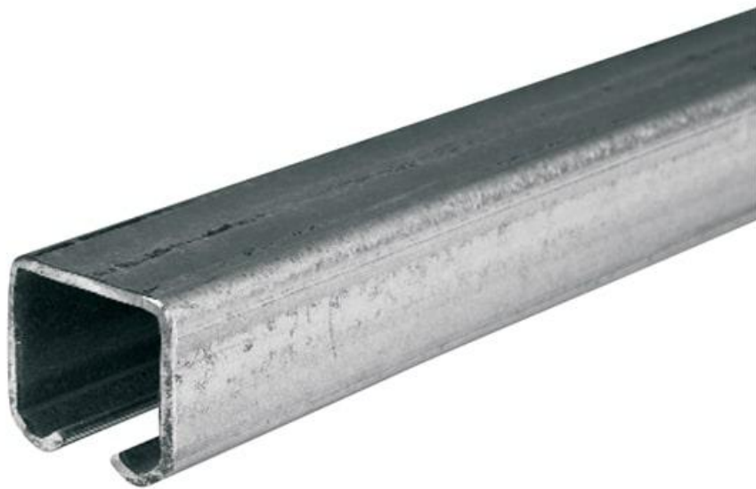
Фото Рельс направляющий подвесной, оцинкованный CAME STRELA 57-3 1700208

Отправьте запрос на коммерческое предложение и получите индивидуальные цены и сроки поставки