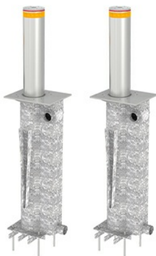
Фото Блокиратор автоматический выдвижной TBD 220H500 CAME TBD-220H50-2

Тел: +7 499 681-75-28 | Email: sale@came-russia.ru | https://came-russia.ru