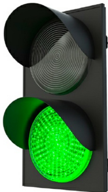
Фото Светофор двухсекционный стандартный со столбом CAME TRFL-200

Отправьте запрос на коммерческое предложение и получите индивидуальные цены и сроки поставки