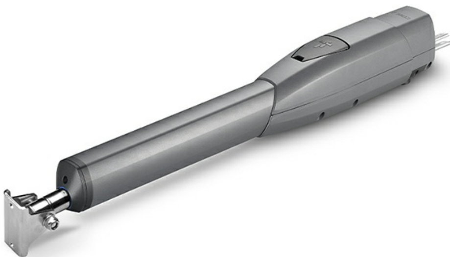
Фото Привод 24 В линейный, самоблокирующийся, со встроенными концевыми выключателями, для створок до 5 м. CAME W01MP-0140

Отправьте запрос на коммерческое предложение и получите индивидуальные цены и сроки поставки